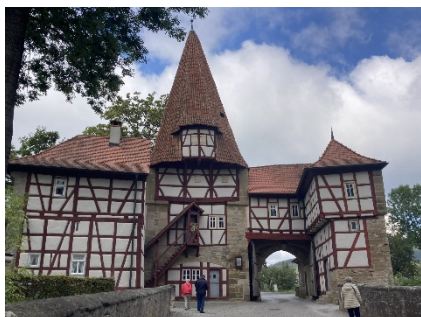
Staden Iphofen besöker vi