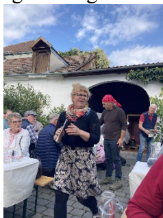
Provning hos Schreiner