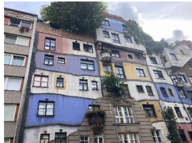
Hundertwasserhaus i Wien

För att delta i resan bör man kunna ta sig fram i trappor och backar utan hjälpmedel. Vissa promenader ingår i programmet och ibland får man stå under informationstid/guidning.