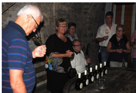
Vinprovning från "bocksbeutel"-flaskan